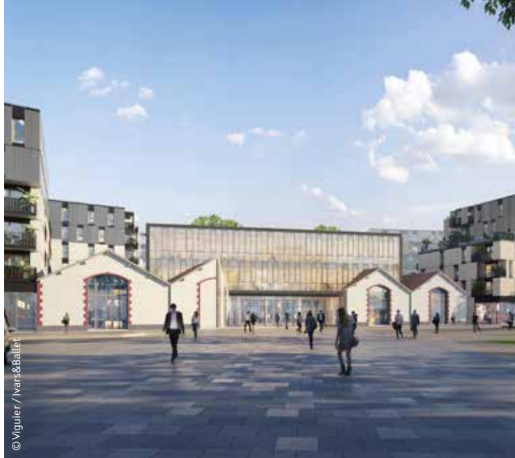
© Viguière / Ivars & Ballet

En octobre, les travaux de démolition partielle de l'ancien mur d'enceinte des Casernes Beaumont Chauveau situé rue du Capitaine Pougnon vont permettre de réaliser une voie provisoire d'accès aux différents chantiers de la ZAC à l'est. Cette démolition est préalable au démarrage du programme mixte « Le Carré Rabelais » fin 2022. Pour mémoire, le projet porté par le groupement de promoteurs COGEDIM/QUATRO comprend des logements, des bureaux, des commerces, une crèche et la « Maison du Bois ». Les premières livraisons sont prévues pour fin 2024.