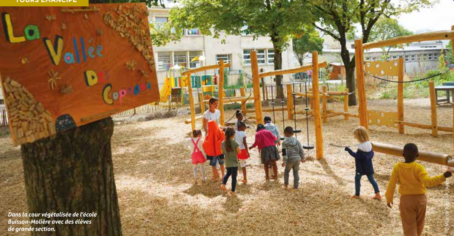
Dans la cour végétalisée de l'école Buisson-Molière avec des élèves de grande section.