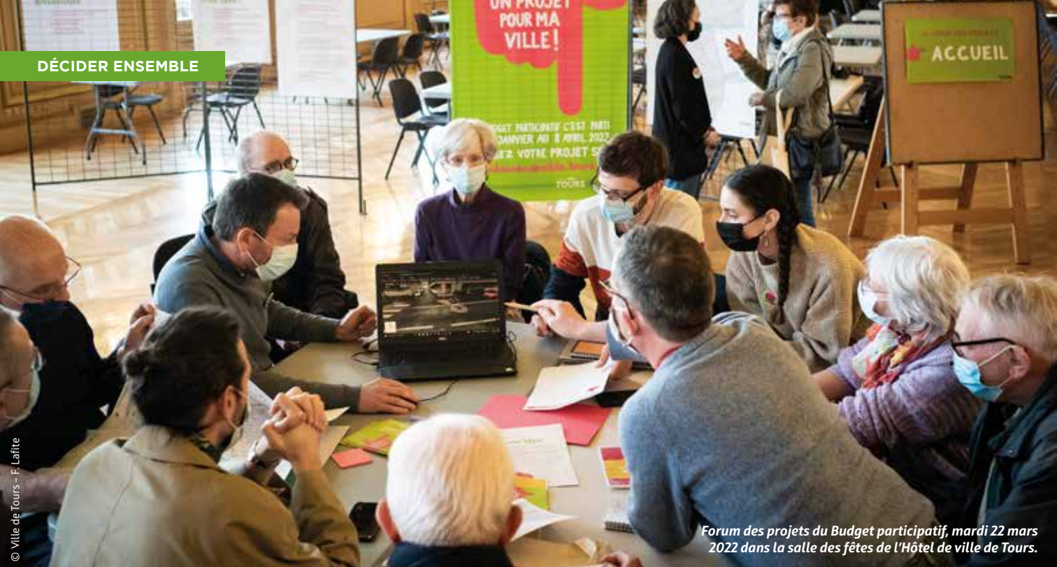
Forum des projets du Budget participatif, mardi 22 mars 2022 dans la salle des fêtes de l'Hôtel de ville de Tours.