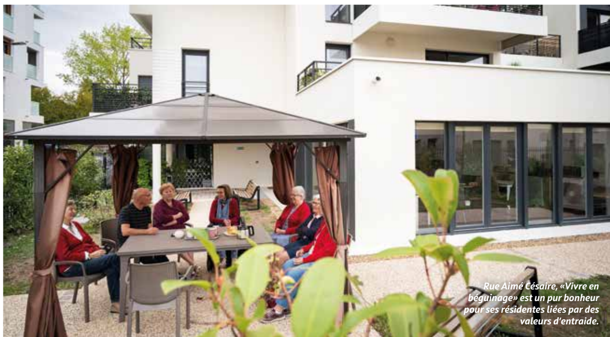
Rue Aimé Césaire, « Vivre en béguinage » est un pur bonheur pour ses résidentes liées par des valeurs d'entraide.

Inauguré à Tours en 2019, un modèle unique de structure communautaire pour les seniors préserve leur autonomie et les gardent socialement actifs : c'est le béguinage. Comme la colocation intergénérationnelle, il relève du « bon sens » et gagne à être connu.