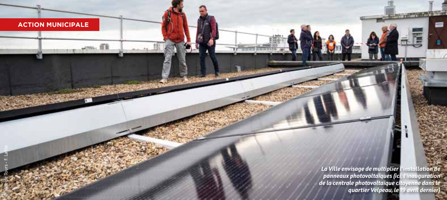
La Ville envisage de multiplier l'installation de panneaux photovoltaïques (ici, l'inauguration de la centrale photovoltaïque citoyenne dans le quartier Velpeau, le 19 avril dernier)