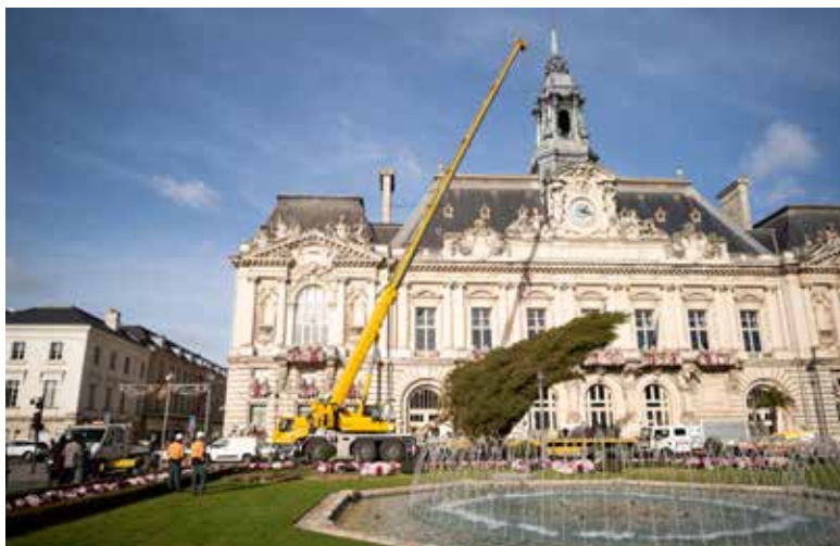
FÊTES DE FIN D'ANNEE