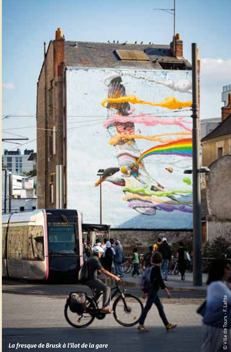
La fresque de Brusk à l'îlot de la gare

Autre point de fixation pour ce mouvement artistique, Passage du Pèlerin, au pied de la Tour Charlemagne. Tous les deux mois, l'association Le M.U.R. Tours , soutenue par la Ville et en partenariat avec Mécénat Touraine Entreprises, fera appel à un nouvel artiste pour y faire éclater, bombes de couleurs en mains, l'étendue de son talent. Le premier est MrDheo , artiste portugais internationalement reconnu. « J'aime perpétuer la mémoire des peintures classiques en les adaptant aux sociétés modernes et au monde dans