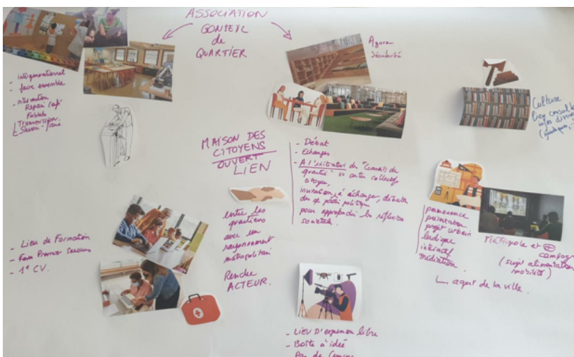
Photo : L'équipement idéal selon le groupe 4

Le futur équipement de la Démocratie Permanente atterrira en Haut de la Tranchée, mais que viendra-t-on y faire exactement ?