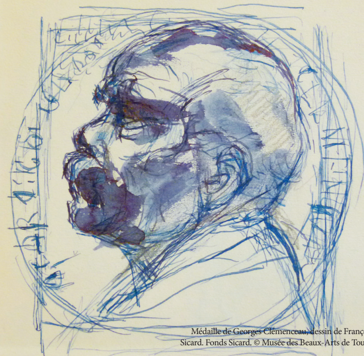
Médaille de Georges Clemenceau, dessin de François Sicard. Fonds Sicard.