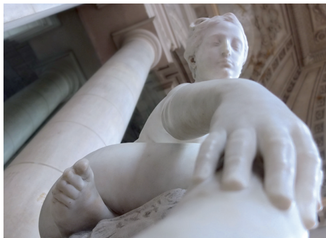
Couverture haut : atlante soutenant le balcon de l'hôtel de ville.

Décédé à Paris en 1934, il choisit de reposer au cimetière de Tours dans un modeste caveau orné d'une de ses œuvres.