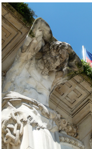
Atlante soutenant le balcon de l'hôtel de ville.