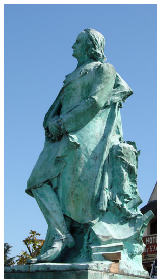
Monument à Alfred de Vigny - Loches.