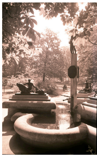
Fontaine du jardin de la Préfecture en 1961.