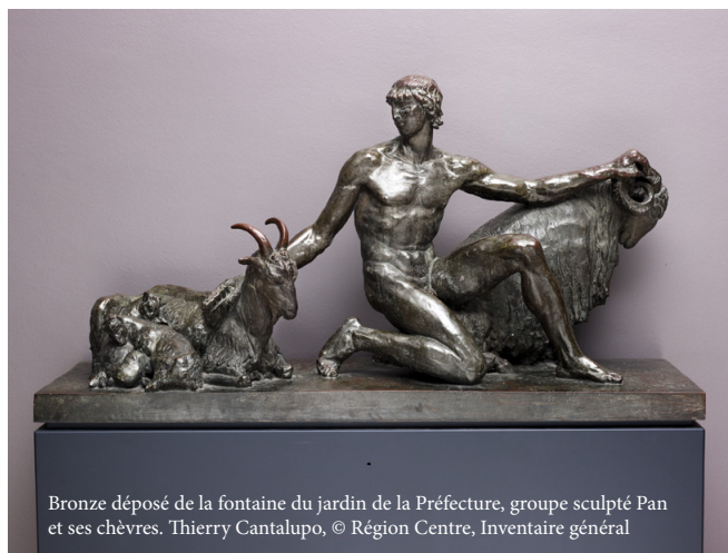
Bronze déposé de la fontaine du jardin de la Préfecture, groupe sculpté Pan et ses chèvres.