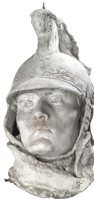
Moulage du groupe sculpté du monument aux morts du lycée Descartes. Tête du soldat - Musée des Beaux-Arts de Tours.

Bien que l'inauguration ait eu lieu en 1904, la statue n'est installée à l'endroit prévu qu'en 1910. Quelques temps plus tard, pour des raisons pratiques, le monument est déplacé et trouve son emplacement actuel. On y ajoute dans les années 1920 le nom des élèves morts durant la Grande Guerre.