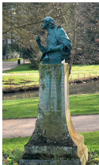
Monument à Racan.