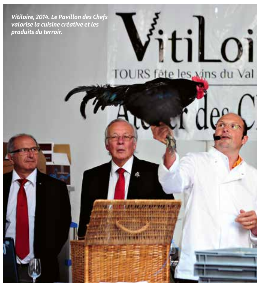
VitiLoire, 2014. Le Pavillon des Chefs valorise la cuisine créative et les produits du terroir.