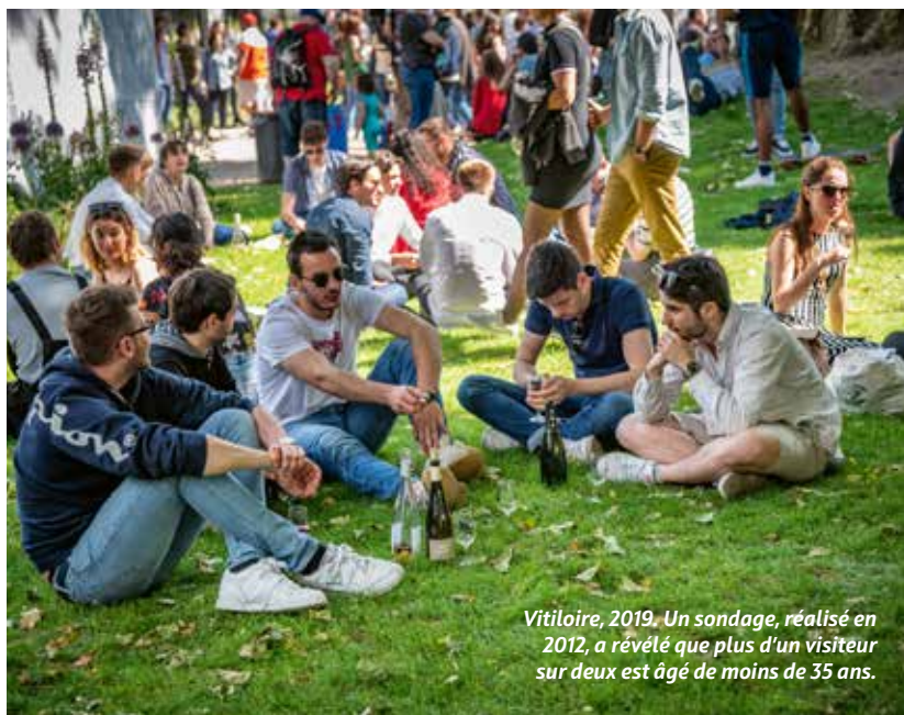
Vitiloire, 2019. Un sondage, réalisé en 2012, a révélé que plus d'un visiteur sur deux est âgé de moins de 35 ans.

Une volonté qui trouve écho lors de l'inscription du « repas gastronomique des Français » au