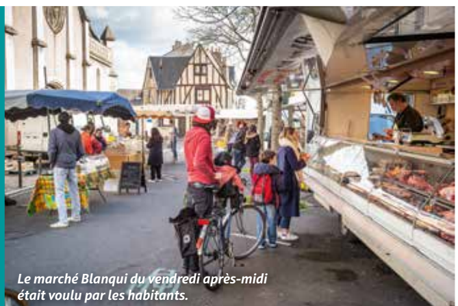
Le marché Blanqui du vendredi après-midi était voulu par les habitants.