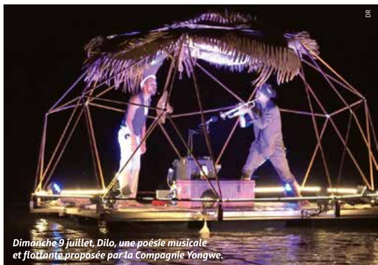
Dimanche 9 juillet, Dilo , une poésie musicale et flottante proposée par la Compagnie Yongwe.