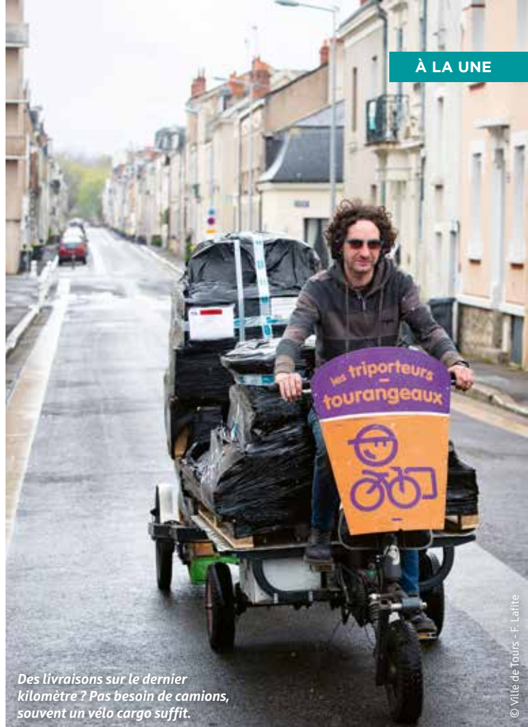
Des livraisons sur le dernier kilomètre ? Pas besoin de camions, souvent un vélo cargo suffit.