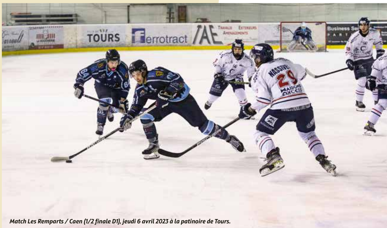
Match Les Remparts / Caen (1/2 finale D1), jeudi 6 avril 2023 à la patinoire de Tours.

Partout, les Tourangelles et les Tourangeaux répondent présents pour soutenir et encourager nos clubs, dans des ambiances incroyables ! Un grand merci et bravo à tous les clubs, leurs bénévoles et supporters, qui pourraient bien faire de l'année 2023 une saison historique.