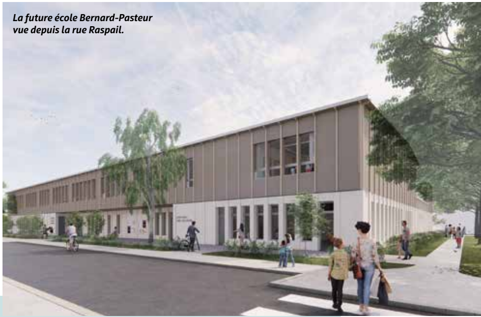
La future école Bernard-Pasteur vue depuis la rue Raspail.