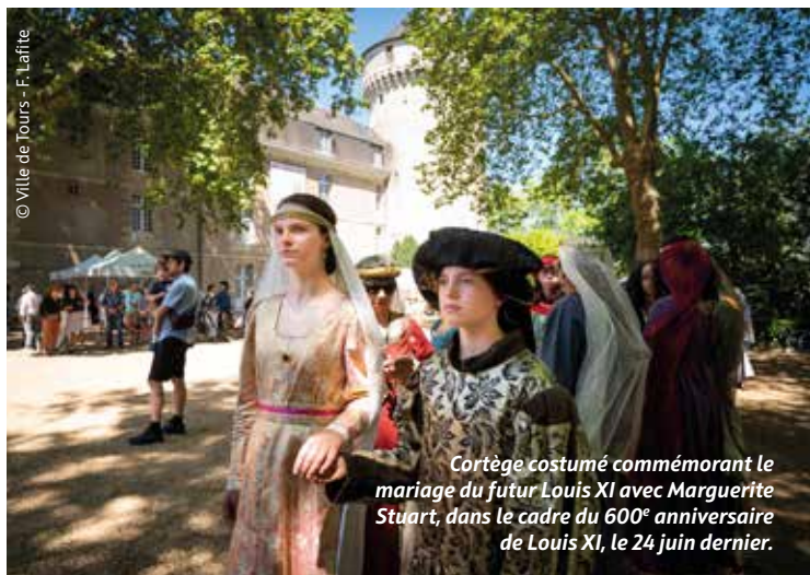
Cortège costumé commémorant le mariage du futur Louis XI avec Marguerite Stuart, dans le cadre du 600 e anniversaire de Louis XI, le 24 juin dernier.