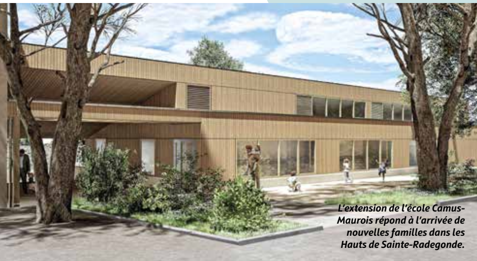
L'extension de l'école Camus-Maurois répond à l'arrivée de nouvelles familles dans les Hauts de Sainte-Radegonde.

Dans le cadre du Schéma directeur numérique éducatif co-construit avec l'Éducation nationale, la Ville met à disposition cet espace numérique (site internet et appli mobile). Les écoles y regroupent les ressources pédagogiques, les cahiers de vie ou de liaison, les travaux d'enfants, mettent en ligne les conseils