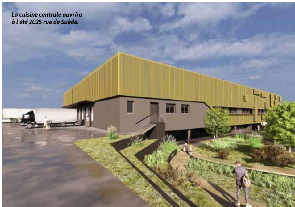
La cuisine centrale ouvrira à l'été 2025 rue de Suède.

Le terrain était occupé par un ancien dépôt de bus Fil Bleu qui sera démolit cette année puis le site sera dépollué et végétalisé. La construction débutera en 2024 et la cuisine, livrée en 2025, abritera une légumerie qui pourra transformer 2 tonnes de fruits et légumes chaque jour, un espace pâtisserie, de nouveaux fours pour une cuisson basse température propice à la conservation des nutriments... La toiture sera coiffée de 1588 m 2 de panneaux photovoltaïques. L'équipement sera adapté à l'utilisation des contenants inox lavables qui remplaceront les barquettes jetables (19 tonnes en déchets en moins chaque année). La Ville met en place un parcours pédagogique pour sensibiliser les enfants et les parents d'élèves au bien-manger grâce à un potager, un mini-verger et un mur de projection. Le coût total du projet s'élève à 16,80 M€HT dont 10 M€ pour les travaux auxquels s'ajoutent le coût des équipements et celui des études.