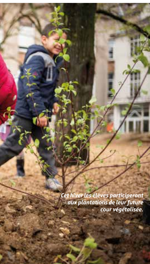
Cet hiver les élèves participeront aux plantations de leur future cour végétalisée.

en cette rentrée. Deux cours ont été débitumés cet été dans les écoles Jules-Verne et Paul-Bert et seront végétalisés lors des « Plantations citoyennes » début 2024. À Jules-Verne, les élèves profiteront d'un potager, d'une haie fruitière, de jeux en bois et d'un parcours sensoriel. Les jardiniers facétieux ont même prévu un clin d'œil à l'auteur de « Vingt Mille Lieues sous les mers » : un motif végétal de pieuvre. La petite cour de l'école Paul-Bert proposera une pergola pour s'abriter sous les plantes