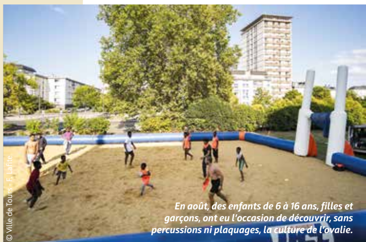
En août, des enfants de 6 à 16 ans, filles et garçons, ont eu l'occasion de découvrir, sans percussions ni plaquages, la culture de l'ovale.

Les lundis et jeudis de 18 h 45 à 20 h 15 des jeunes de 14 à 17 ans