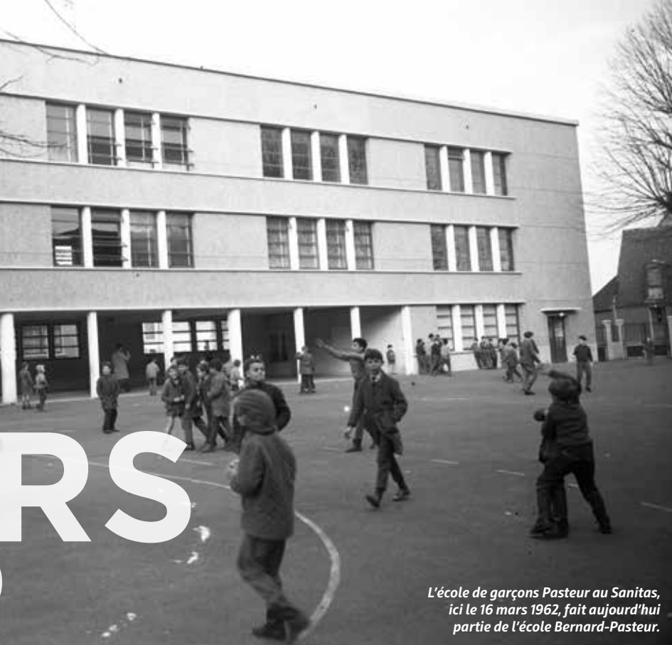
L'école de garçons Pasteur au Sanitas, ici le 16 mars 1962, fait aujourd'hui partie de l'école Bernard-Pasteur.