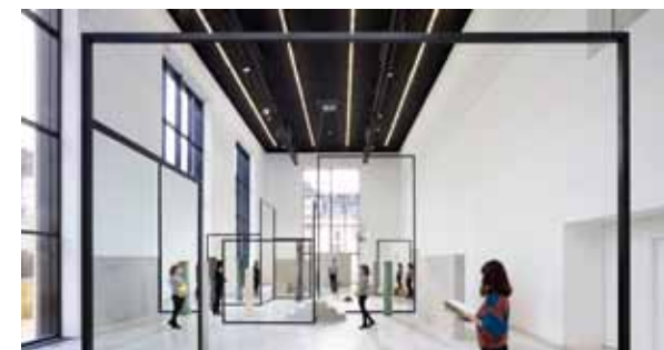
Alicja Kwade. Photo: F. Fernandez - ccc od, Tours. Courtesy the artist and kamel mennour, Paris / London

Les dessins de Fabien Mérelle décrivent un univers fantastique entrelacé de mythologies personnelles. Ces espaces de rêverie, minutieusement construits à l'encre noire, affirment pourtant un réalisme tranchant qui ne demande qu'à sortir de la page blanche.