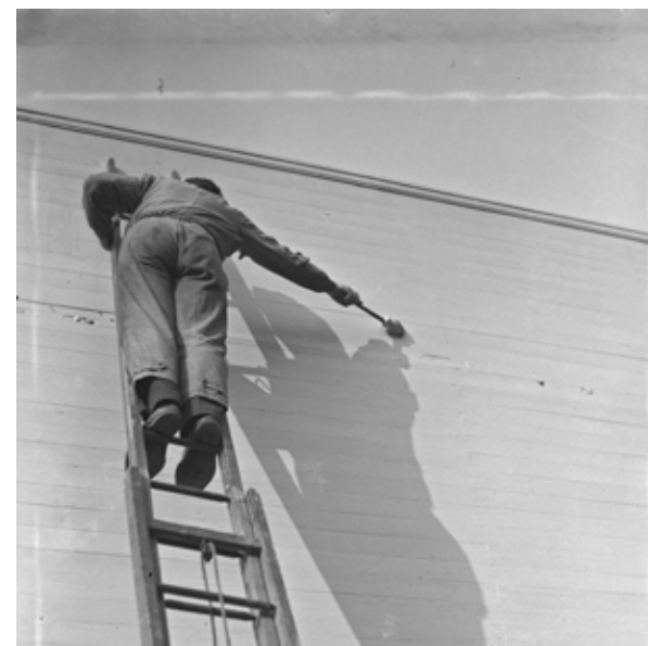
© André Kertész, Peintre d'ombre, Paris, 1926, ministère de la Culture / Médiathèque de l'architecture et du patrimoine © Donation André Kertész