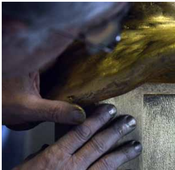
Application de la patine